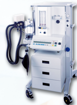
Cirrus trans II/vent II

Wir bieten qualifizierten, flexiblen und kostentransparenenten Service für die Produkte der Hersteller GE Healthcare/Datex Ohmeda und Heinen & Löwenstein sowie Dräger.